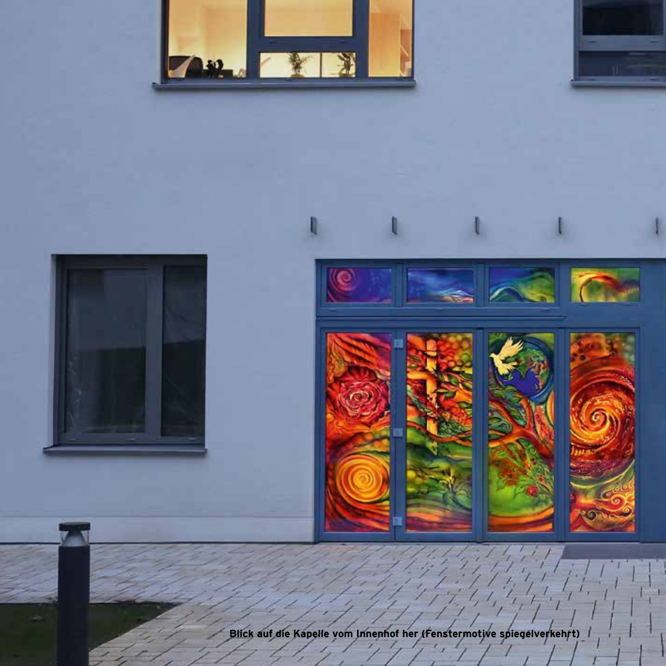
Blick auf die Kapelle vom Innenhof her (Fenstermotive spiegelverkehrt)